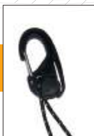
Mousquetons de réglage