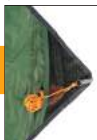
Petite poche pour caser les cordes