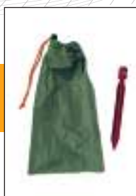
4 Y-sardines incluses