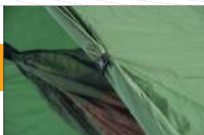
Protection variable contre le vent (peut être enroulée)

Matériel de fixation inclus, Y-sardines et mousquetons de réglage. Extrêmement imperméable. Petit volume une fois plié.