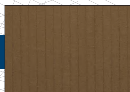
100 % nylon ripstop

A l'aide d'un matelas de randonnée, vous pouvez utiliser l'underquilt même en dessous de 0°C.