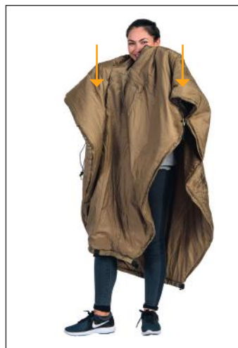
2. Passer sur la tête