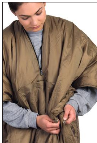
3. Fermer les boutons pression