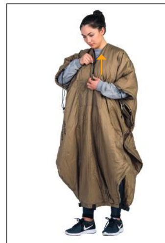
4. Fermer la fermeture à glissière