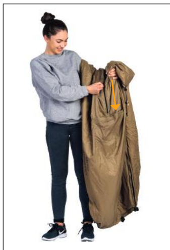
1. Ouvrir la fermeture à glissière