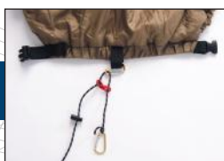
Corde pour fixer l'underquilt (réglable en continu et amovible)