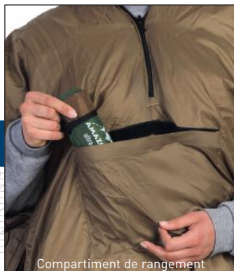
Compartiment de rangement